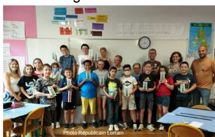
Calculatrices offertes par la municipalité aux futurs collégiens - 06/2022