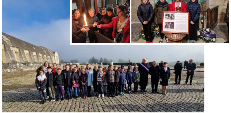
Les CM2 de l'école Romain Rolland à Verdun le 10/11/2022