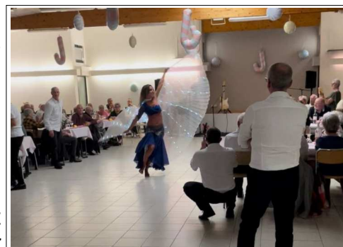
Prestation de danse orientale lors du repas du 02/10/2022

La distribution des bons de fin d'année aux aînés a débuté le 21 novembre 2022 en mairie. Ils retrouvent leur montant précédent, le repas des aînés ayant pu se dérouler normalement : 20€ pour une personne seule, 25€ pour un couple.