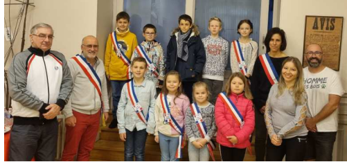
Installation du nouveau CMJ le 19/11/2022