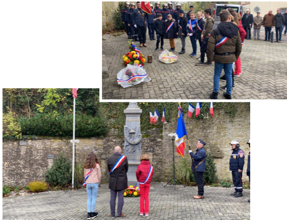
Cérémonie du 11 novembre