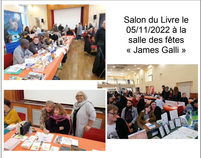
Salon du Livre le 05/11/2022 à la salle des fêtes « James Galli »