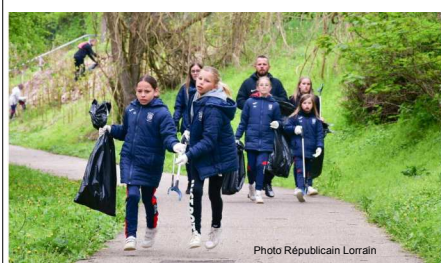
Nettoyage de printemps 23/04/2022