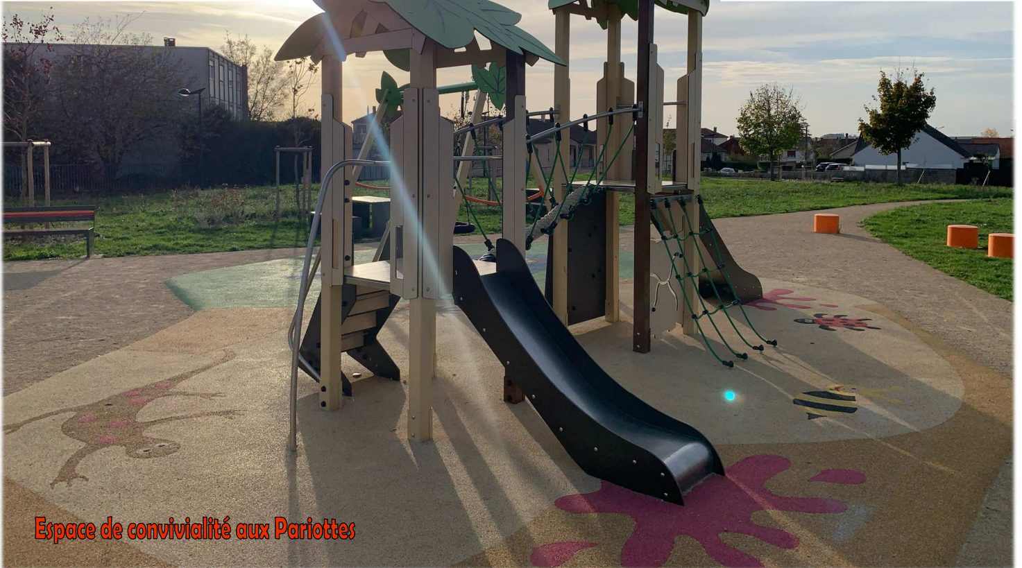
Espace de convivialité aux Pariottes